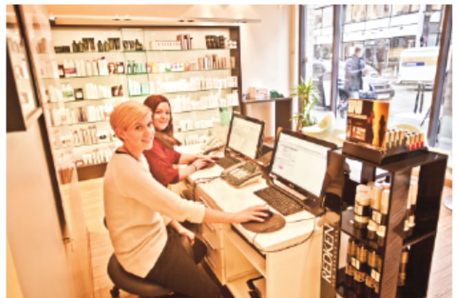
På Håret avdeling Sandvika er en av mange fornøyde brukere av systemet.