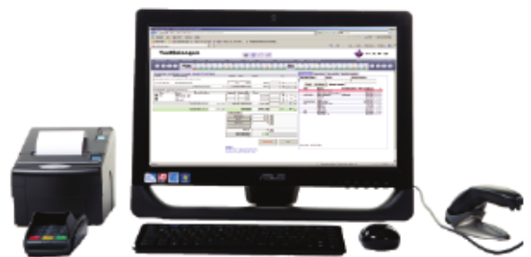
Eksempel på et oppsett av hardware med PC integrert i skjermen